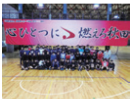
中・高連携強化プロジェクトⅠ（パフォーマンステスト）の様子