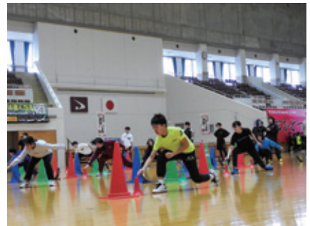
腰を落とすことがポイント！

研修のメインとなった「アジリティ」とは、切り返し動作や方向転換などの敏捷性を意味します。本研修では、色や音の合図を脳で判断し、素早く筋肉に伝達して動き出すトレーニングを重点的に行いました。楽しい場面と集中する場面を繰り返すことで、選手たちは体力的にははきついながらも、終日笑顔を決やさずトレーニングに取り組みました。