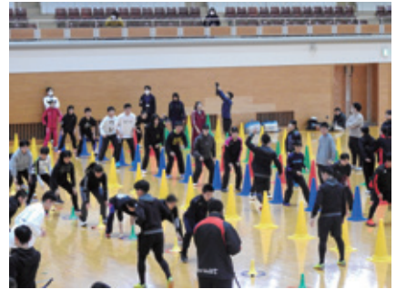
熱気に包まれた会場