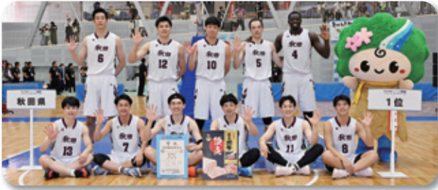
バスケットボール 秋田県成年男子チーム