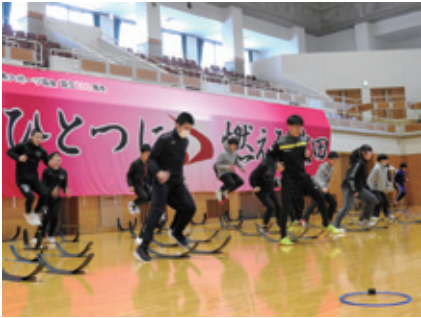
ミニハードルを使ったトレーニング

令和6年2月12日に秋田県中学生強化選手とチームAKITA強化・育成システム指定競技の高校生選手、県内の中高生アスリートを中心に、18競技122名の県内ジュニアアスリートと11競技19名の指導者が、弱点を克服するための冬期間に行うべきフィジカルトレーニングを学びました。本研修は、昨年11月に実施したパフォーマンステスト（体力測定）で課題となった「アジリティ」と「初速のスピード強化」に特化したトレーニング研修となっており、これらを強化すべく、関東圏を中心にジュニアアスリートを指導しているCASQ SPEED TRAINING SCHOOLの6名の講師陣からさまざまな手法のトレーニングを学びました。