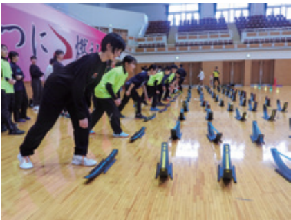
競争が選手の心に火をつける！