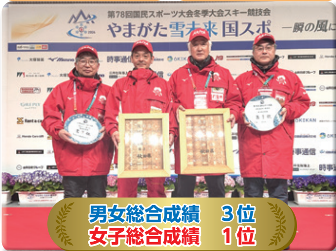
男女総合成績 3位 女子総合成績 1位