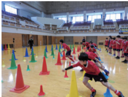
切り返し動作でリード出来ることを実感