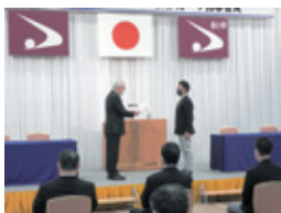
指定証交付式の様子（第1期）