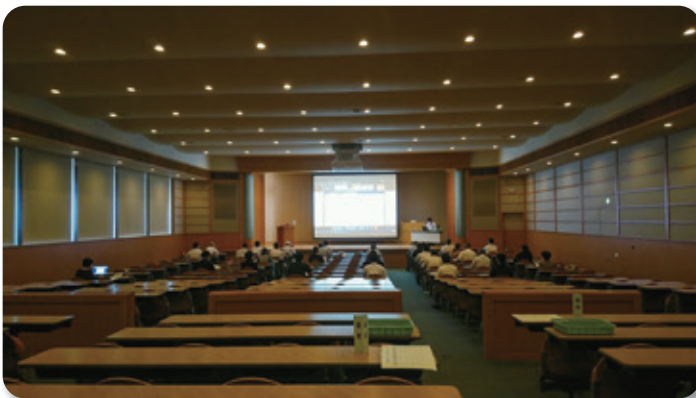
秋田県第2庁舎8F大会議室(説明会の会場)

最新の「総合型スポーツクラブ登録・認証制度の概要」について資料を元に説明が順序立てて行われ、56団体並びに秋田県や県スポーツ協会の関係者が真剣に聞き入っていました。