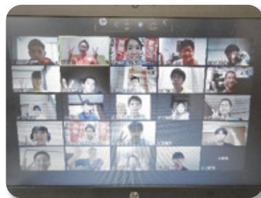
ウェブ上で集合写真!