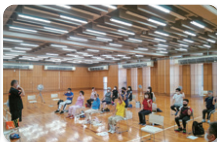
②秋田県スポーツ科学センター3F体育場(7月17日)