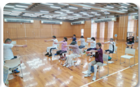
③秋田県スポーツ科学センター3F体育場(8月8日)