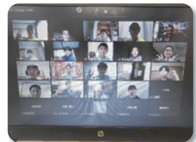
来年は実地での研修を願って…