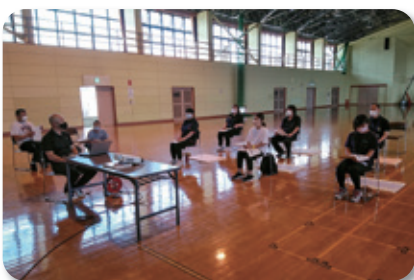
①大館市立比内体育館(6月26日)

（※円熟体操とは、秋田県スポーツ科学センターでプログラム化したストレッチ（脳トレ）・筋力トレーニング・有酸素運動で構成されている体操です。）講師は秋田県スポーツ科学センターのスポーツ主事の皆様に務めて頂き、A講習を①6月26日(土)、②7月17日(土)、③8月8日(日)に3回開催しました。前期のA講習は12クラブから28名の方が受講しました。後期のB講習（④8月21日、⑤8月28日、⑥9月11日）は、県内の新型コロナウイルス感染拡大のため延期になりました。B講習については感染状況を見極めながら今年度中に再度開催する予定です。（A講習1回とB講習1回を受講終了した方に普及員証と認定証書が発行されます。）